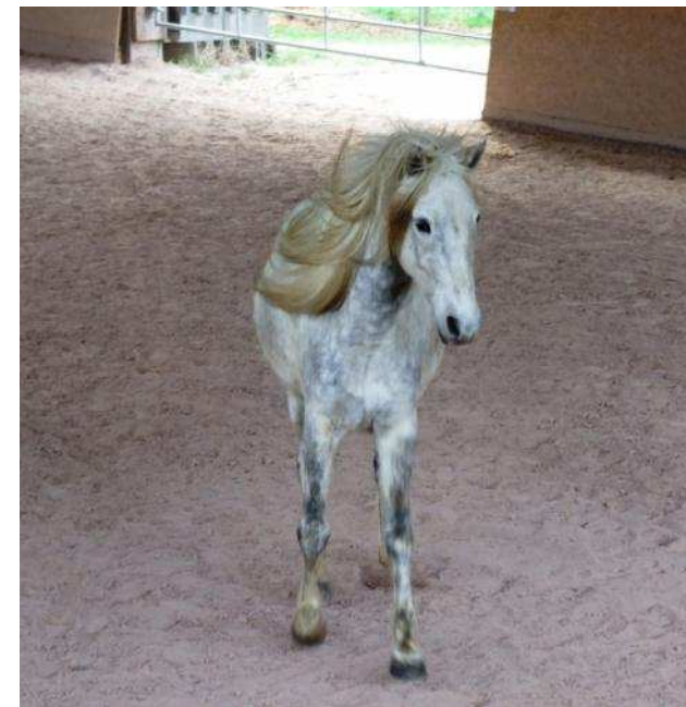
© Dr. S. Geipert / U. Wagner