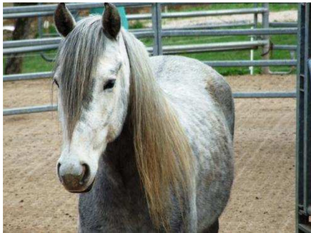
Die Hohe Schule der Führung